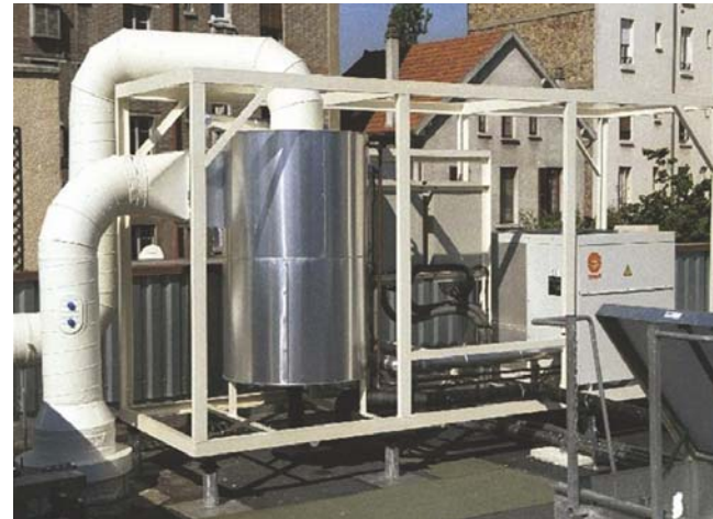
AIREC'ODOR installé en toiture